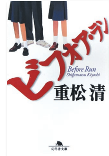
『ピフォア・ラン』（幻冬舎文庫/1998年）