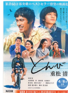
『とんび』（角川文庫/2022年）