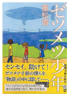
『ゼツメツ少年』（新潮文庫/2016年）