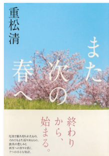
『また次の春へ』（扶桑社/2013年）