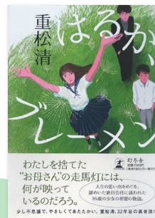
『はるか、プレーメン』（幻冬舎/2023年）