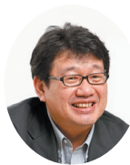
重松 清