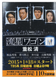
『流星ワゴン』（講談社文庫/2005年）