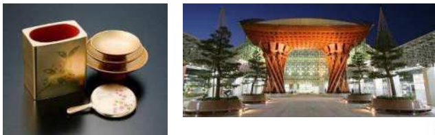
石川県金沢市 (2009年、クラフト&フォークアート)