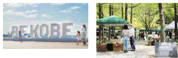
兵庫県神戸市 (2008年、デザイン)