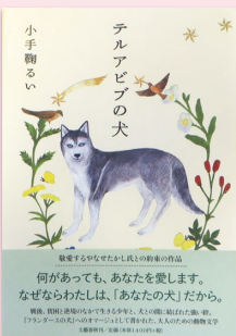
『テルアビブの犬』 (文藝春秋／2015年)