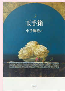
『玉手箱』 (ベネッセコーポレーション／1995年)