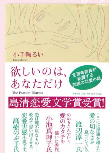
『欲しいのは、あなただけ』 (新潮社／2004年)