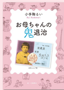
『お母ちゃんの鬼退治』 (偕成社／2022年)