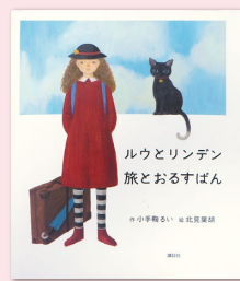
『ルウとリンデン 旅とおるすばん』 (講談社／2008年)