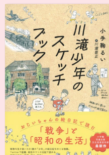
『川滝少年のスケッチブック』 (講談社／2023年)