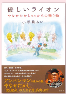
『優しいライオン やなせたかし先生からの贈り物』 (講談社／2015年)