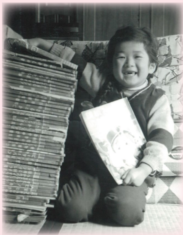
講談社の絵本がこんなに…(4歳のころ)