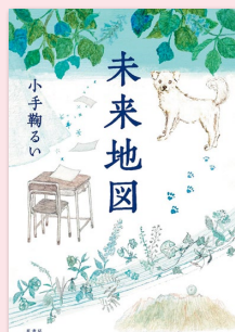
『未来地図』 (原書房／2023年)