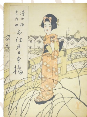
セノオ楽譜「お江戸日本橋」 (セノオ音楽出版社/大正5年) 表紙絵は夢二によるもの。