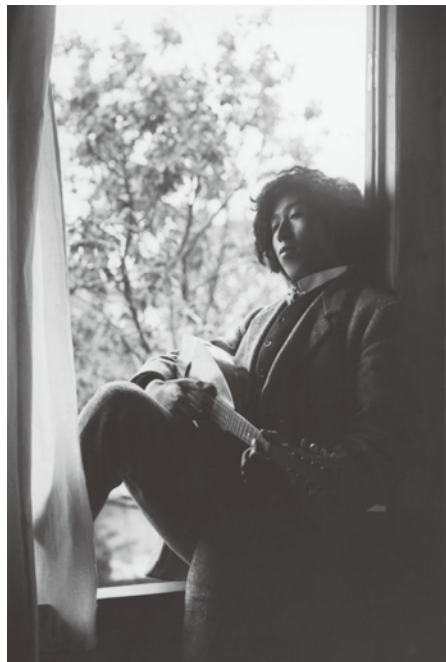
1910(明治43)年頃の夢二

2024年、画家・詩人の竹久夢二は、生誕140年・没後90年という節目の年を迎えます。これを記念して、特別展「生誕140年・没後90年 竹久夢二展」を開催いたします。