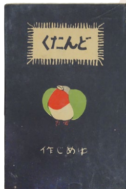
詩集『どんたく』 (実業之日本社/大正2年)