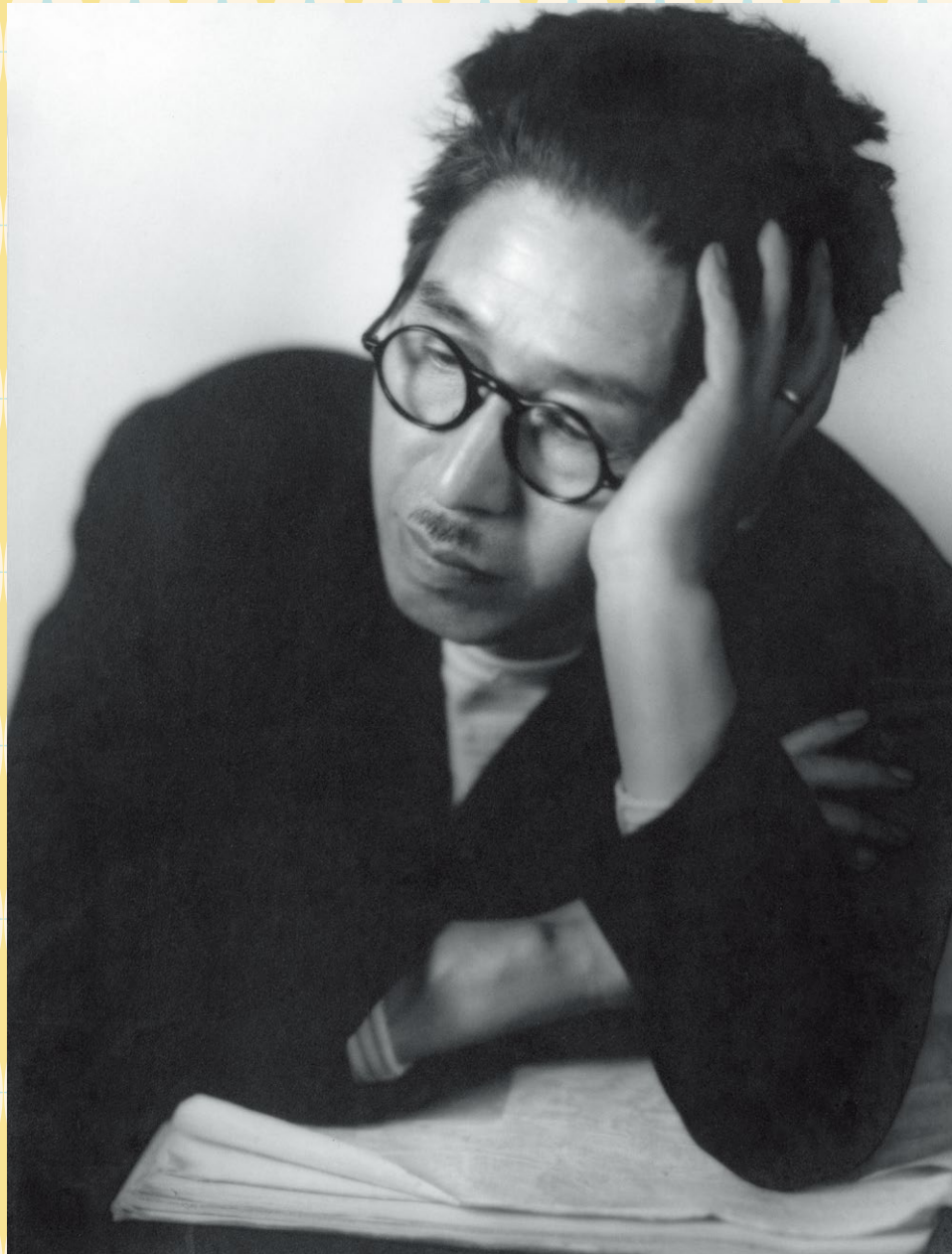
「夢二ポートレート」1932(昭和7)年頃