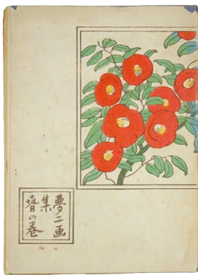
『夢二画集 春の巻』 (洛陽堂/明治42年)