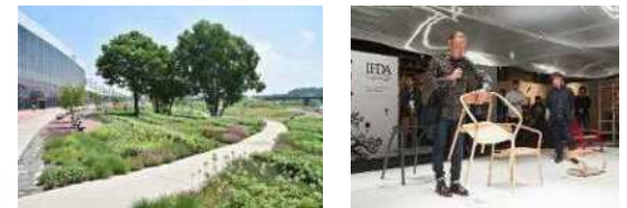
北海道旭川市 (2019年、デザイン)