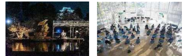
愛知県名古屋市 (2008年、デザイン)