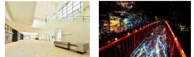
北海道札幌市 (2013年、メディアアート)