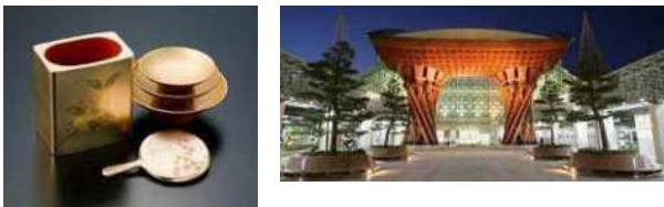
石川県金沢市 (2009年、クラフト&フォークアート)