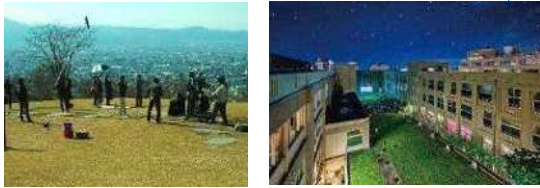
山形県山形市 (2017年、映画)