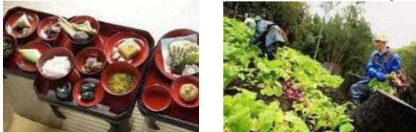
山形県鶴岡市 (2014年、食文化)