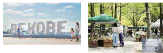
兵庫県神戸市 (2008年、デザイン)