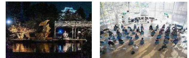
愛知県名古屋市 (2008年、デザイン)