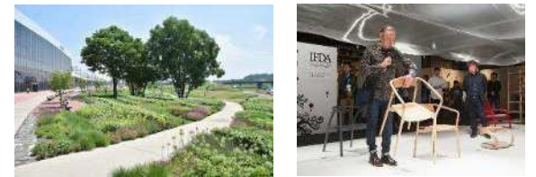
北海道旭川市 (2019年、デザイン)