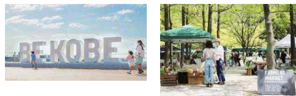
兵庫県神戸市 (2008年、デザイン)