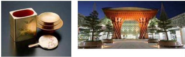
石川県金沢市 (2009年、クラフト&フォークアート)