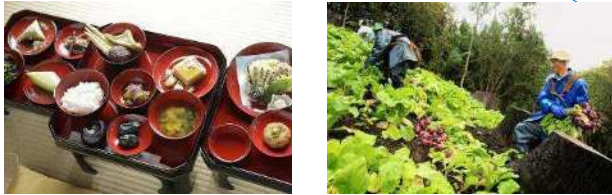
山形県鶴岡市 (2014年、食文化)