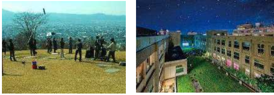
山形県山形市 (2017年、映画)