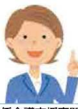
主任介護支援専門員 (主任ケアマネジャー)