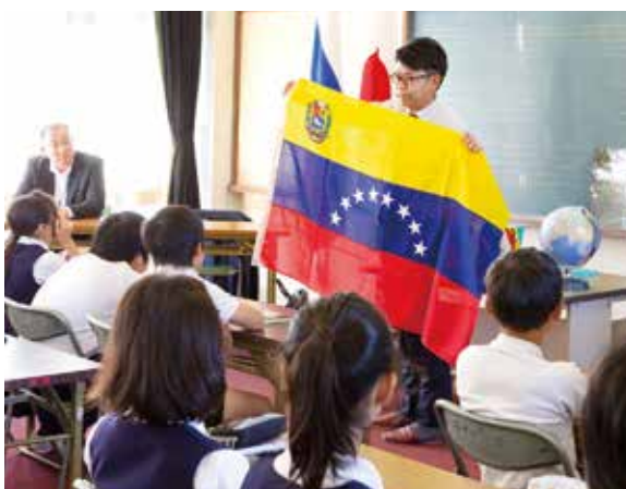
小玉氏による授業の様子