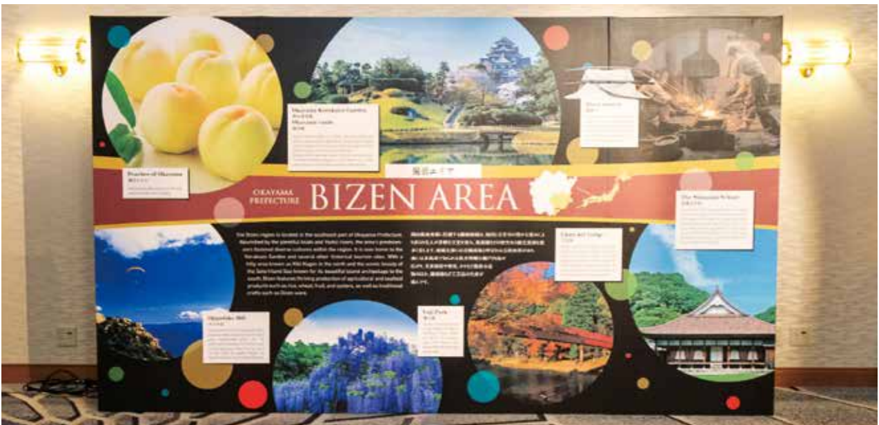
備前地域紹介パネル

岡山県下の各地域の魅力や日本遺産、また、岡山の保健福祉医療の取り組みを紹介したパネルを3階ホワイエに展示しました。