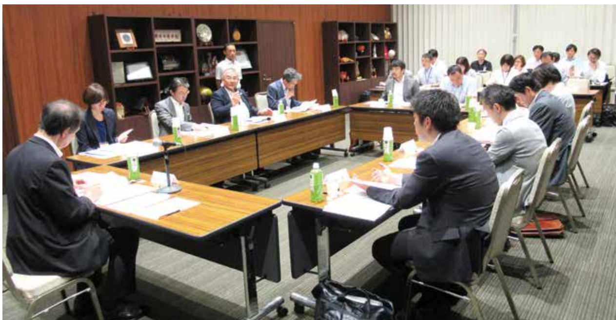
保健・医療部会での協議の様子