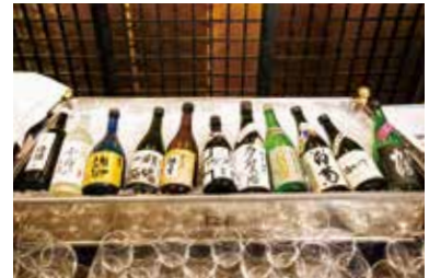
蔵元からご提供いただいた銘酒