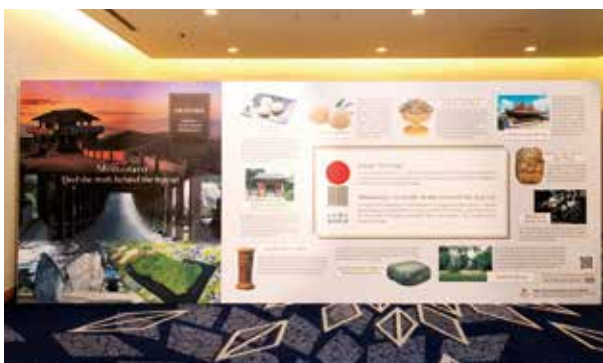
日本遺産「桃太郎伝説」の生まれたまち おかやま 紹介パネル