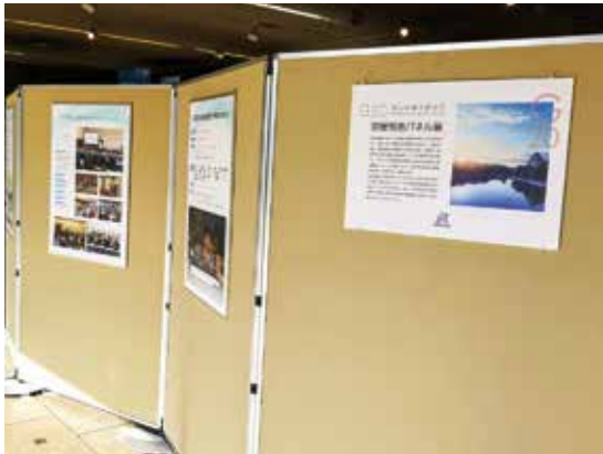
岡山市役所での開催報告パネル展の様子