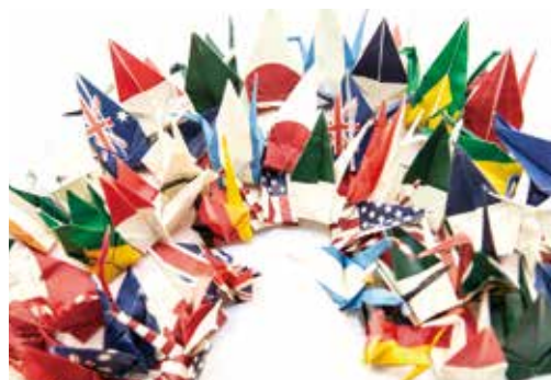
国旗模様のおりづる