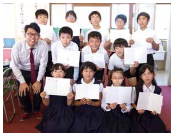
小玉氏と子どもたち