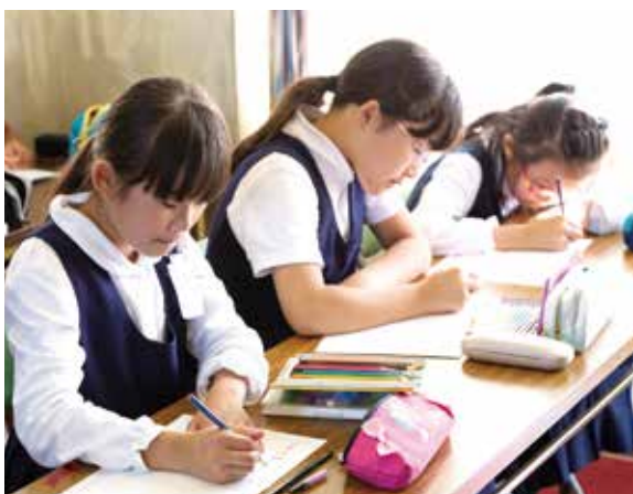
メッセージカード作成の様子