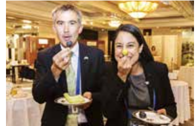
大粒のブドウは代表団の方々に大好評