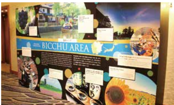
備中地域紹介パネル