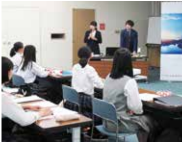
厚生労働省職員による特別授業の様子

■講 師 厚生労働省 大臣官房国際課 G20厚生労働関係閣僚会合等開催準備室 職員2名