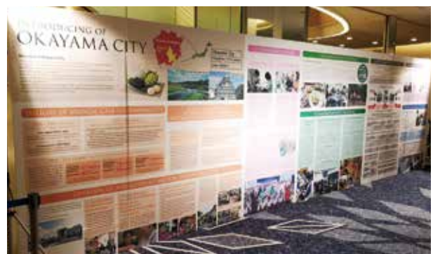
岡山の保健福祉医療紹介パネル