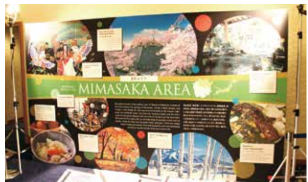
美作地域紹介パネル