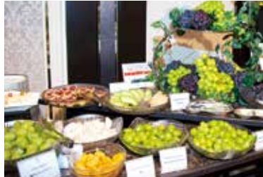
フルーツコーナー

岡山中央卸売市場の提供によるシャインマスカットとニューピオーネを中心に、岡山の旬のフルーツを取り揃えました。