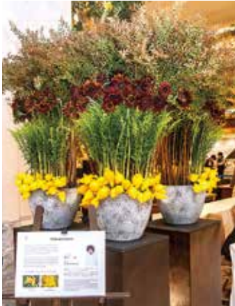
岡山産の花を使用した装花(1階ロビー) (協力:岡山県花き消費拡大実行委員会)