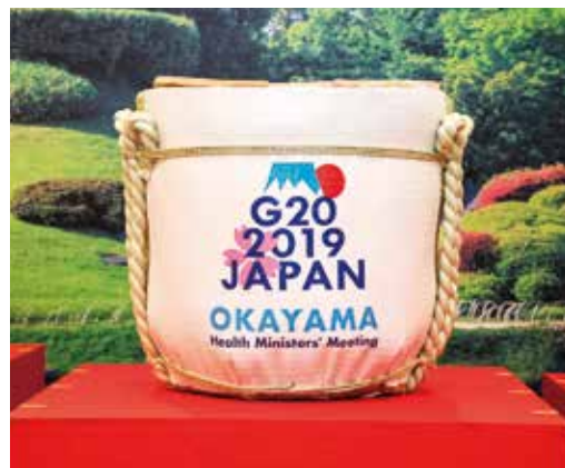
鏡開きに使用した酒樽