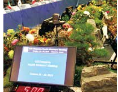
会合会場の装花(4階フェニックス)