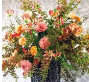
レセプション会場の装花(3階クリスタル)