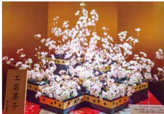
工芸菓子(4階ホワイエ 協力:株式会社宗家源吉兆庵)

株式会社宗家源吉兆庵の協力により、桜をモチーフにした工芸菓子(食用可能な素材で作られた造花)を、4階ホワイエに展示しました。