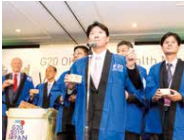
伊原木岡山県知事による乾杯の発声