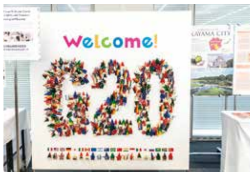
おりづるウェルカムボード(メディアセンター)

「おかやまっこ未来フェスタ2019」の国旗おりづるワークショップで、子どもたちがG20の国旗の模様の折り紙で折ったおりづるをウェルカムボードに貼り付けました。大臣会合中はメディアセンターに設置しました。