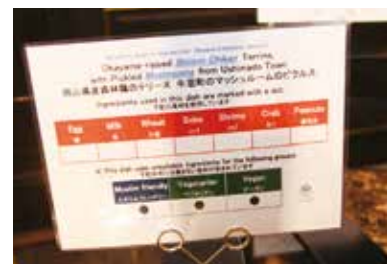
アレルギー等の説明プレート