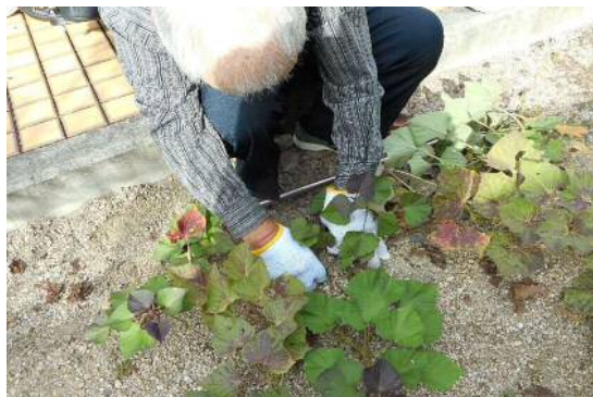
さつまいもの収穫(南側の菜園にて)