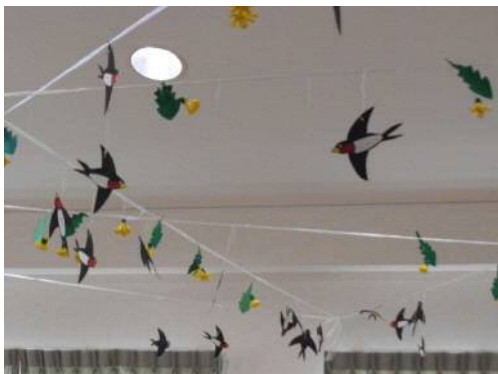
季節に合わせた天井飾り