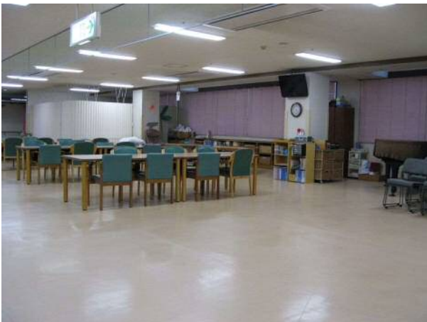
デイサービスフロア全景