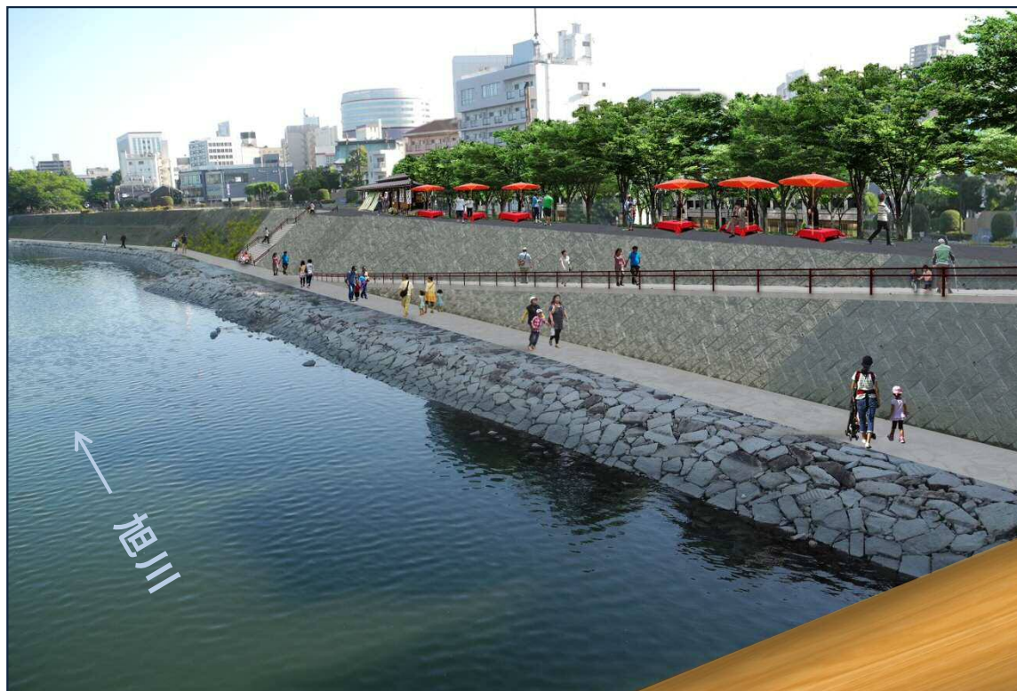
【旭川西側整備イメージ】