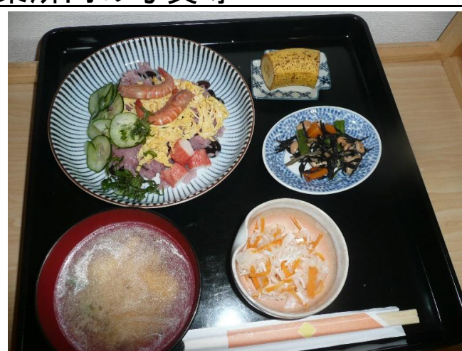
手作りの食事の一例