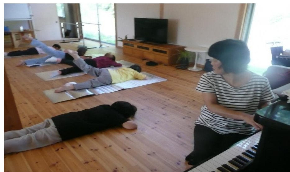
ピアノ伴奏付きの体操風景