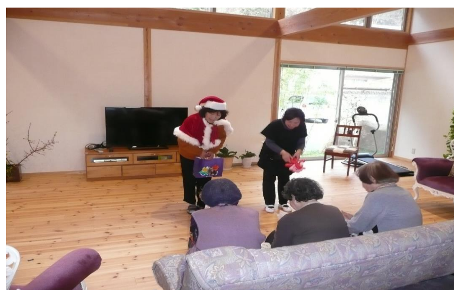
クリスマス会などの季節の行事