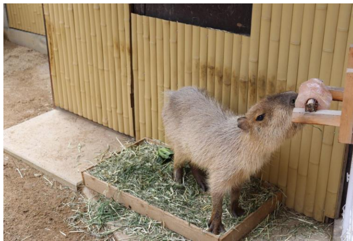
↑ エンリッチメントの工夫→