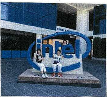
「ホストファミリーと！」