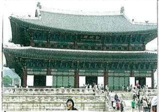
↑景福宮の「勤政殿」中に王様のいすがかざってある