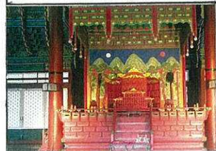
↑王様が座るいす赤が多く使われていてきれいだった

景福宮はソウルの特別市にある、朝鮮王朝時代の王宮です。中へとも広く、5つの王宮の中で一番大きいです。また、韓服を来ていくと、入場料が無料というサービスもあり、たくさんの方が着ていました。