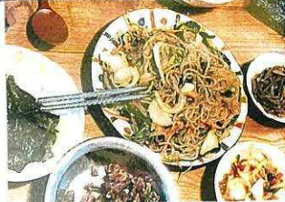
↑チャプチェの写真

理で、味つけが濃い目のものが多いです。お祝いのときなどの定番料理とされています。