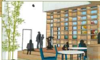
親子ふれあい コーナー