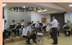
【関西高校吹奏楽部】