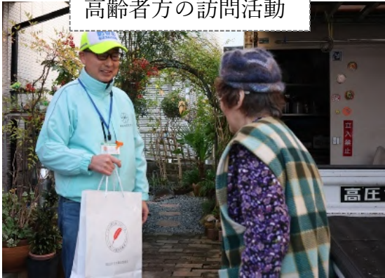
高齢者方の訪問活動