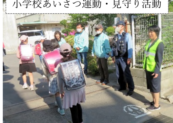
小学校あいさつ運動・見守り活動