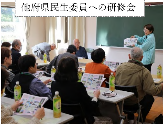
他府県民生委員への研修会