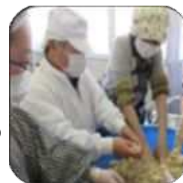
前回の味噌づくりの様子

発酵食品の代表格であるお味噌を手作りしてみませんか。大豆を炊く作業にも参加していただきます。仕込んだ後は各自で持ち帰り、熟成をします。