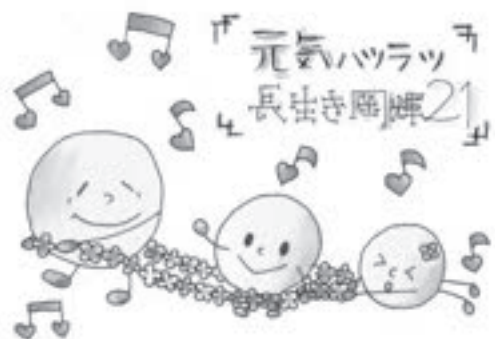
元気ハツラツ長生き岡輝21ロゴマーク

岡山市では、すべての市民が健康で自分らしく生きられるまちを目指して、『健康市民おかやま21』が平成15年に策定されました。地域・家族・職域・行政等が力を合わせて、市民一人ひとりの主体的な健康づくりを推進しています。