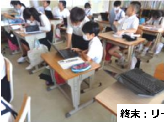
終末：リーフレットづくり