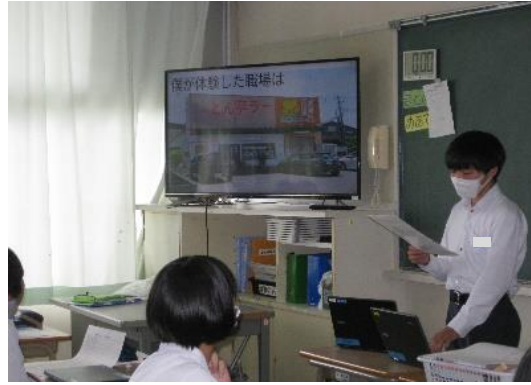
各クラスでの発表