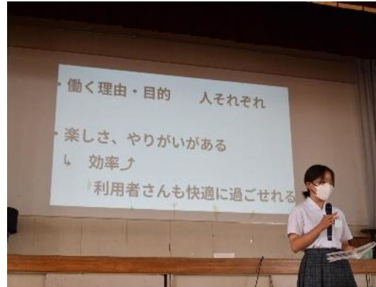
「働く意義」まで探求して説明

中学校2年生で、職場体験学習をさせていただいた事業所の場所や仕事内容、体験したこと、苦労したことなどをChromebookのスライドにまとめ、1人3分程度で発表しました。また、各クラスの代表生徒による学年発表会も行われ、練りに練ったプレゼンテーション、堂々とした態度や説明に成長を感じられました。