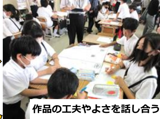
作品の工夫やよさを話し合う