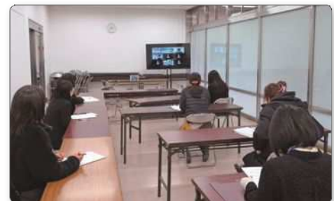
災害時多言語支援センター設置訓練の様子

（一財）岡山県国際交流協会、岡山県、倉敷市との共催で「外国人と共に学ぶ災害時対応」研修会をオンラインで2月13日に実施し、避難所を想定した通訳シュミレーションや講演などを行いました。1月16日には同じくオンラインで災害時多言語支援センター設置訓練を同協会、岡山県、倉敷市と共に行いました。