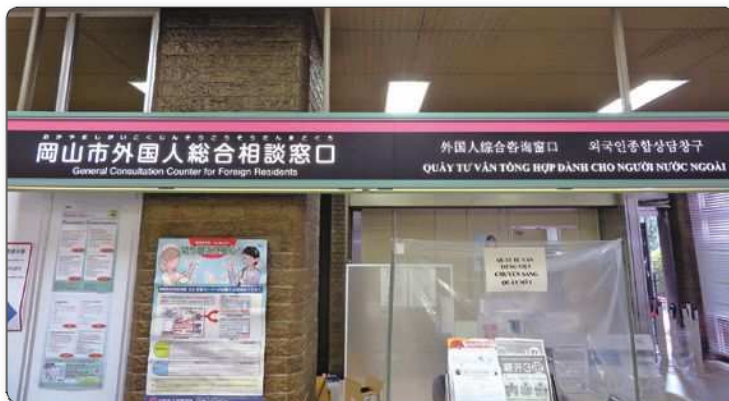
岡山市外国人総合相談窓口（市役所本庁舎1階）

外国人市民の方々の生活を支援するため、困りごとに関する相談や情報提供を一元的に担う「岡山市外国人総合相談窓口」を設置し、日本語が分からないなどの事情により市役所での手続きや生活相談などができなくて困っている方の相談を受け付けています。