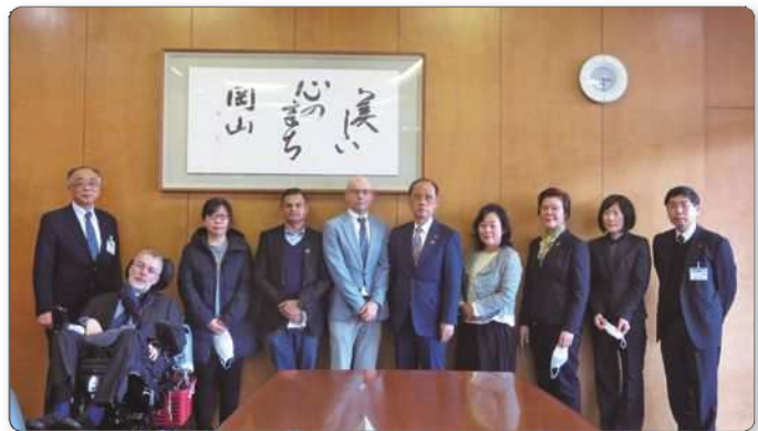
岡山市外国人市民会議（第6期）委員のみなさんと岡山市長

第6期委員が令和2年1月から2年間の審議を経てまとめた提言書を1月28日に岡山市長に提出しました。