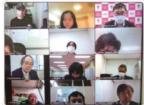
岡山市多文化共生推進ネットワーク会議の様子

2月15日にオンライン会議を開催し、21団体が参加しました。会議では新型コロナワクチン接種や臨時特別給付金、岡山市パートナーシップ宣誓制度等について情報交換しました。