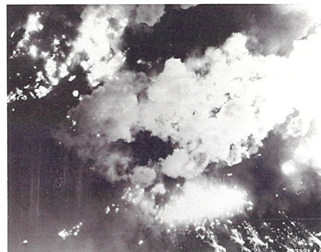
空襲される岡山市街地 1945年6月29日