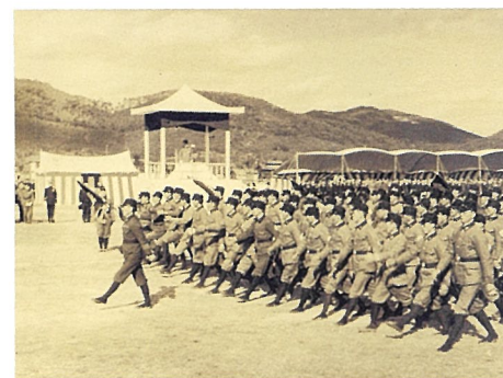
警防団防空隊の分列式 1942年11月29日

※チラシ表面の写真 （中央） 空襲から4分後を指したまま止まった腕時計 （背景） 岡山市公会堂（現・県庁付近）から西を見る 1945年10月