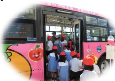
整理券をとってバスに乗車