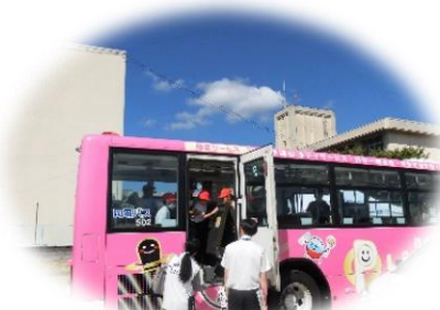
非常脱出口の確認