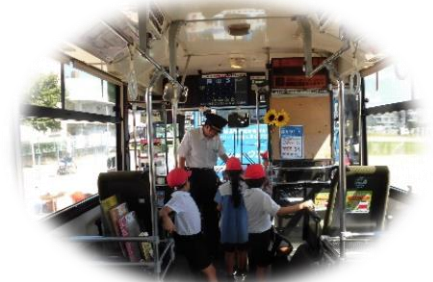
運賃の支払方法を学習