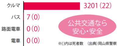
交通事故件数（岡山県／令和2年度）

公共交通は、通勤や通学、買い物、通院、旅行など、皆様の日常生活に欠かせない移動手段ですが、利用者の減少により、厳しい経営状況が続いており、存続が危ぶまれています。公共交通を持続可能なものにするため、外出の際は、安心・安全で、カラダと家計にやさしい公共交通を積極的にご利用いただきますようお願い申し上げます。