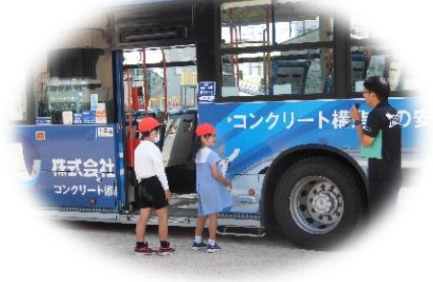
バスのインターホン体験