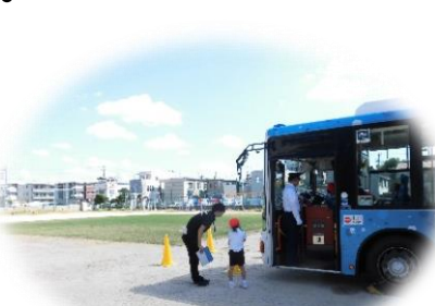
前方の死角を確認