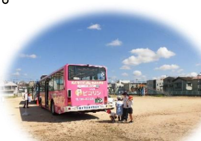
後方の危ない場所を学習