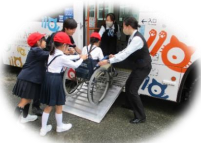
バスのスロープ体験(車イス)