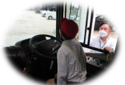
運転席からの見え方を体験