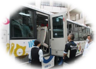
非常脱出口の確認