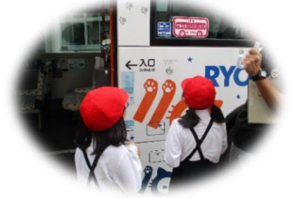
バスのインターホン体験