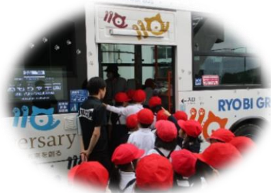
整理券をとってバスに乗車