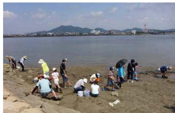
連携中枢都市圏事業 『干潟の植物と生き物観察隊!!』