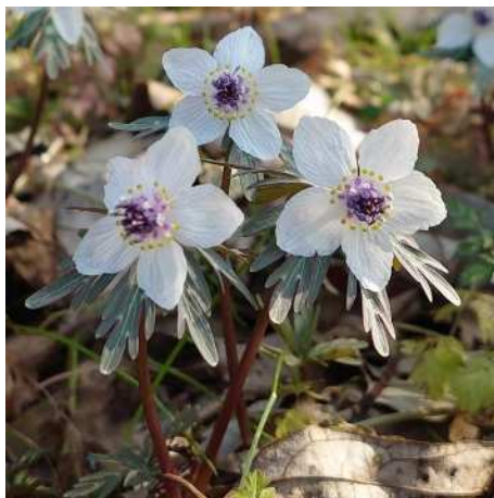
Photo by poyo_piyo_photograph (いいかも！おかやまの自然 Instagramフォトコンテスト入賞作品)

このため、現在14の地域が指定されている「身近な生きものの里」事業（地域住民による生物多様性の保全・活用を岡山市が支援する事業）の一層の充実・拡大を図ります。また、この事業に加え、調査で明らかになった野生生物の情報などを基に、市域において重要な生態系を有する地域を選定し、保全に努めます。なお、選定にあたっては、各地域の生物多様性について、地域住民が理解や愛着を深め、保全や活用を図る動機づけになる働きかけも行っていきます。