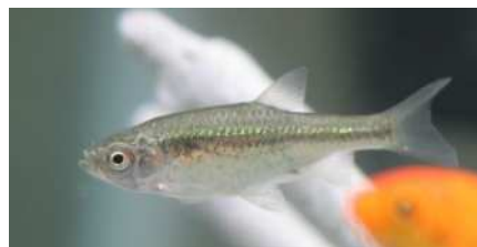
種の保存法 特定第二種国内希少野生動植物種 カワバタモロコ