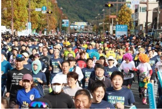
2023年開催時のスタート地点

2023年の大会では、マラソンの定員が戻り、ファンランが復活し、コロナの影響で取りやめになっ