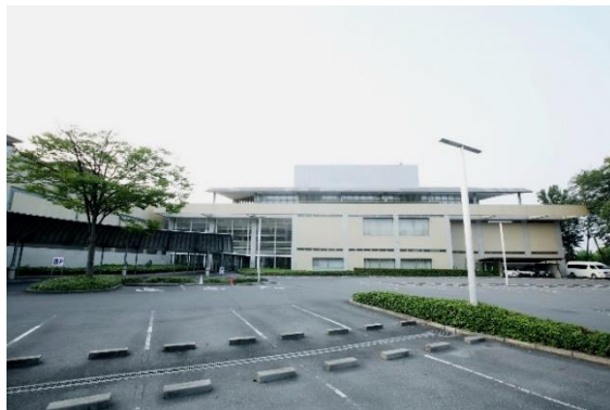
岡山県南部健康づくりセンター全景

障がい者の健康づくりのための環境も備えられていて、パラリンピック出場の手も利用されています。