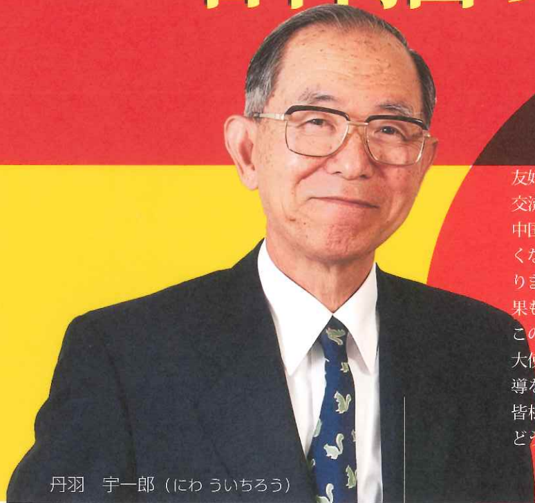
丹羽 宇一郎 (にわ ういちろう)

元中華人民共和国駐劔特命全権大使 伊藤忠商事株式会社名誉理事 公益社団法人 日中友好協会会長 一般社団法人 グローバルビジネス学会名誉会長 福井県立大学 客員教授 1939年 愛知県生まれ。1962年 3月名古屋大学法学部卒業 同年 4月伊藤忠商事入社、主に食料部門に携わる。 1998年4月 同社社長、2004年 会長に就任 2010年 6月～2012年12月 中華人民共和国駐劔特命全権大使 2006年10月～2008年10月 経済財政諮問会議民間議員 2007年4月～2010年3月 地方分権改革推進委員会委員長