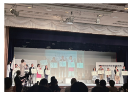
社会貢献者表彰式典