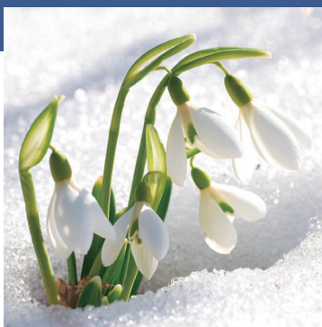
スノードロップ 花言葉：希望