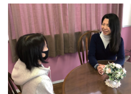
カウンセリングの様子