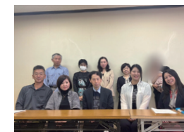
スタッフ集合写真