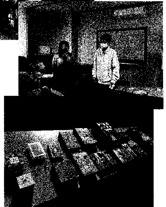
ボードゲームイベント活動詳細