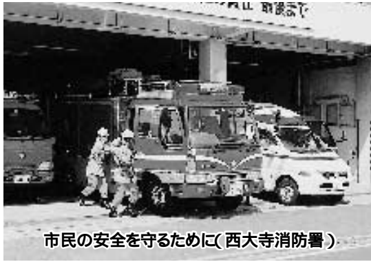
市民の安全を守るために(西大寺消防署)

答 利用会員に対する電話やEメールでの相談支援、ボランティアの募集登録・派遣調整