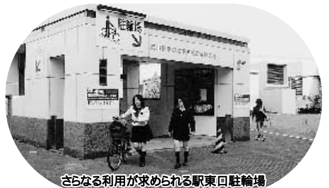
さらなる利用が求められる駅東口駐輪場

答 放置自転車が多数場所に設置するとともに、啓発指導員を配置して誘導したい。学生等を対象にした割引制度の導入を検討している。また、買い物客等に一部企業が配布している無料サービス券を拡大し、PR