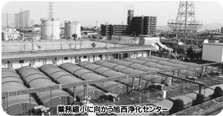
業務縮小に向かう旭西浄化センター