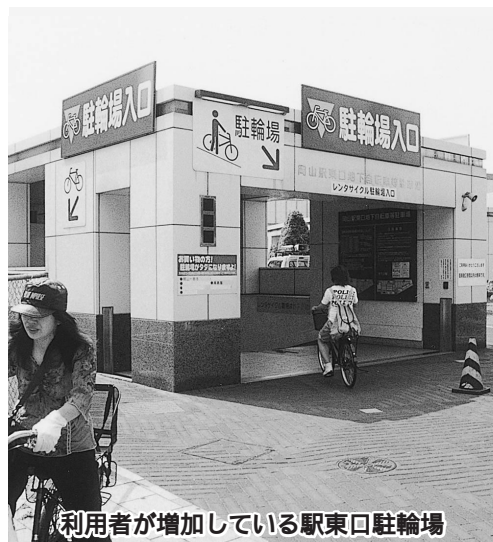
利用者が増加している駅東口駐輪場

今後の市営住宅建設に対する本市の方針は、 答 老朽度や財政状況等を勘案しながら、条件の整った団地から建て替えや統合等を行いたい。建て替えに当たっては、少子・高齢化等の社会経済情勢の変化や市民の多様なニーズに対応するため、生活交流施設や福祉施設等の複合化や世帯構成に応じた住戸の型別供給等により、良好な住環境の形成と地域の活性化を図る方向で検討している。