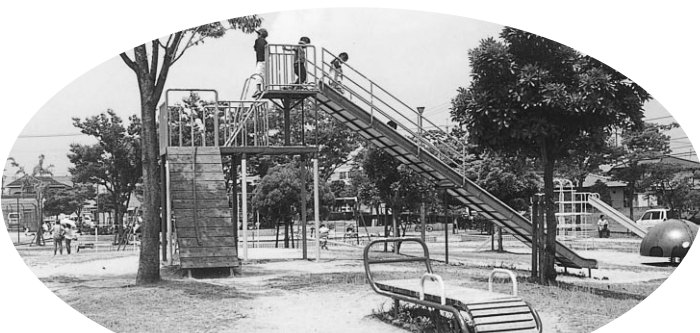
子どもたちが安全に遊べる公園を目指して

問 公園の 安全管理等を市民協働で進めては、破損遊具の連絡先を公園内に設置しては。