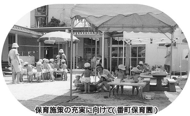
保育施策の充実に向けて(番町保育園)

と倉敷市に居住する児童を互いに受け入れる保育園の広域入所が開始されるが、本市での実施二園の選定方法は、倉敷市での入所可能園の地図の明記を。