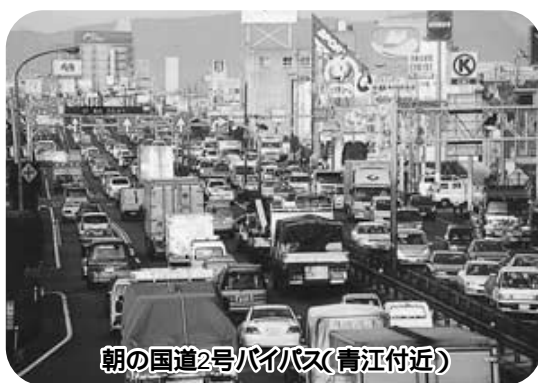
朝の国道2号バイパス(青江付近)

青江・福富西交差点付近の交通渋滞・事故多発の原因は、改善に向けた取り組み状況は。