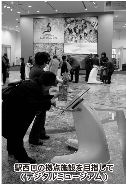
駅西口の拠点施設を目指して (デジタルミュージアム)

【答】 平成17年8月の開館以来入館者は延べ四十一万人を超えている。なお、これまでに開催した十三件の特別展については、二十三万人を超える入館者があったものの、収支については九件が黒字又は収