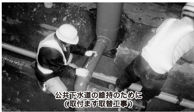
公共下水道の維持のために (取付ます取替工事)

持・修繕による管の延命化を基本に、必要な改築更新を行い、効率的な管理に努めたい。