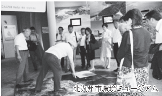
北九州市環境ミュージアム