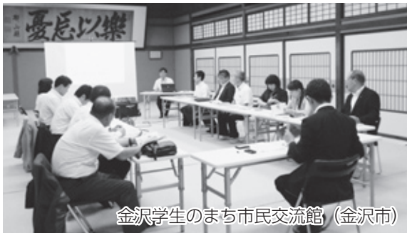
金沢学生のまち市民交流館（金沢市）