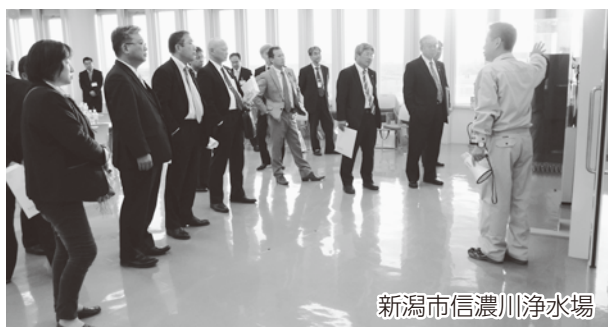
新潟市信濃川浄水場