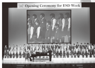
← オープニングセレモニーの様子