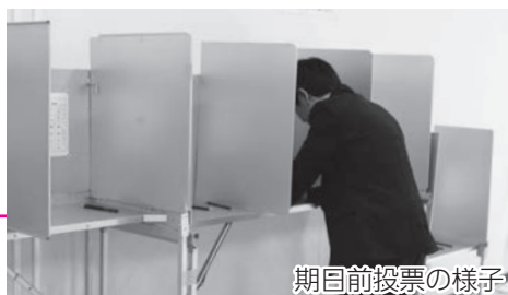
期日前投票の様子

平成27年4月12日に岡山市議会議員選挙が行われ、46名の議員が選出されました。新しい議会構成や議員の紹介等は、7月1日に発行予定の臨時号でお知らせします。