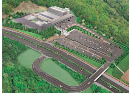
岡山北斎場のパース図