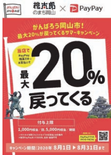
ポイント還元キャンペーン