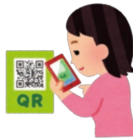
スマートフォン決済でポイント還元

令和4年6月定例市議会に市長が提案した議案は、追加上程を含め38件（予算案4件、条例案9件、その他25件）であり、すべての議案を原案可決・同意ならびに承認しました。