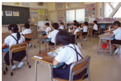
学校給食費の負担を軽減