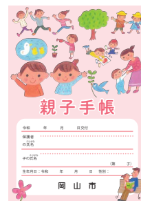
妊娠・出産届出時に 経済的支援

令和4年11月定例会市議会に市長が提案した議案は、追加上程を含め69件（予算案12件、条例案5件、その他52件）でした。そのうち、令和4年度岡山市一般会計補正予算（第4号）など2件の議案については、一部の議員から反対がありましたが、すべての議案を原案可決・同意しました。