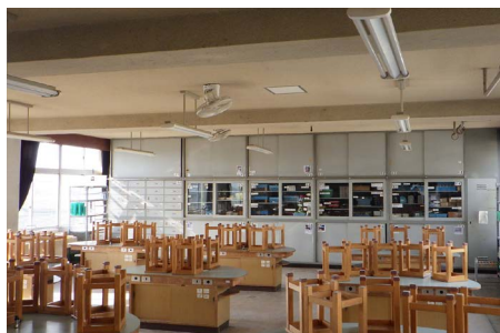
特別教室にエアコンを整備 (写真は理科室)