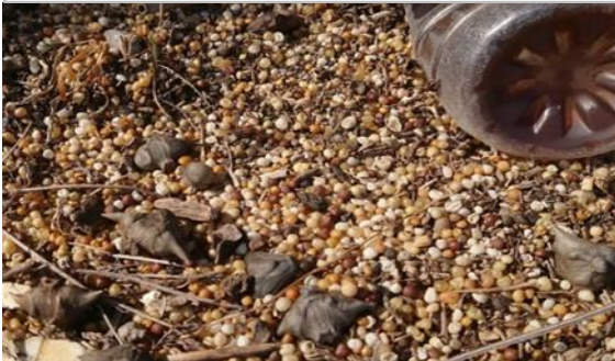
笹ヶ瀬川 堆積している肥料殻