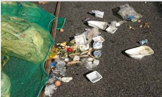
市内の用排水路周辺のごみステーションの様子