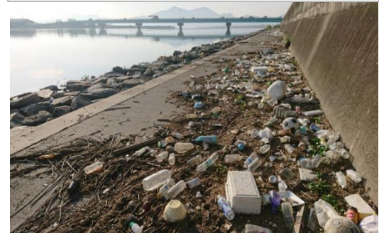
笹ヶ瀬川右岸の漂着ごみ