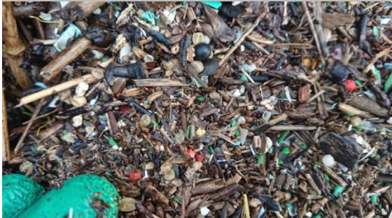
百間川河口 平成水門横の護岸