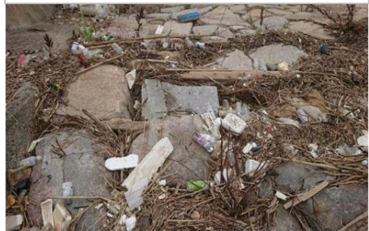
九幡に漂着したプラスチックごみ