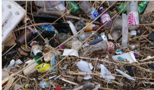
四番川河口護岸に堆積した砕けたプラスチックごみ