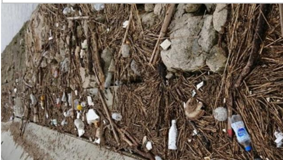
吉井川河口に漂着したプラスチックごみ