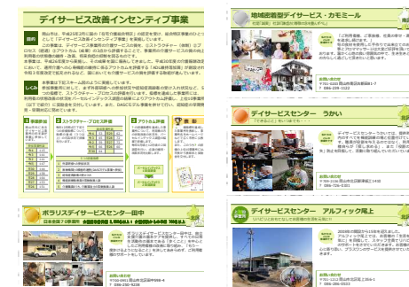
《パンフレット配布場所》