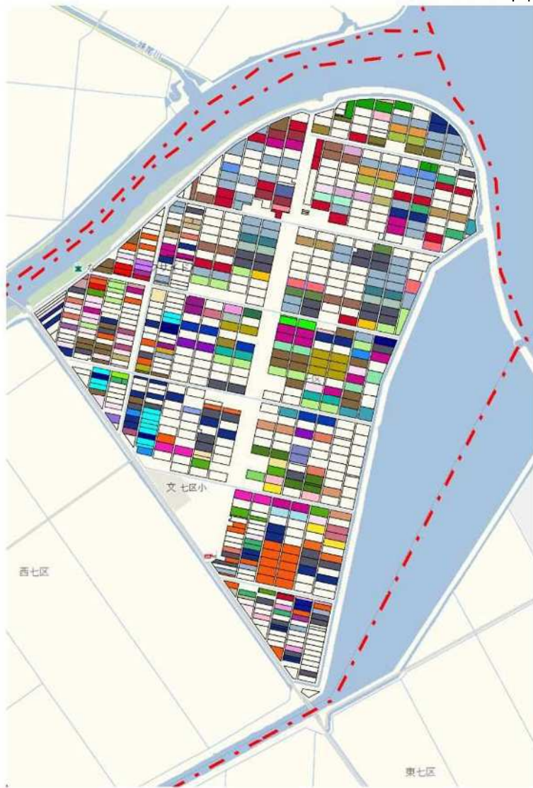
目標地図（南区灘崎地域）