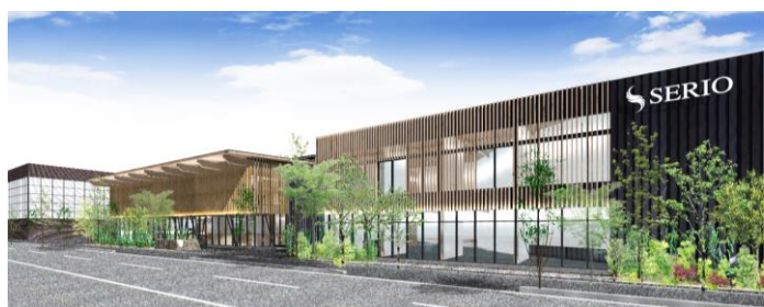
【セリオ株式会社本社完成予想図】