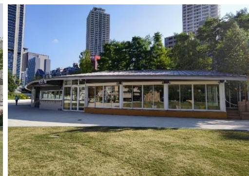
(カフェ・貸しスペース / 東遊園地 / 神戸市)