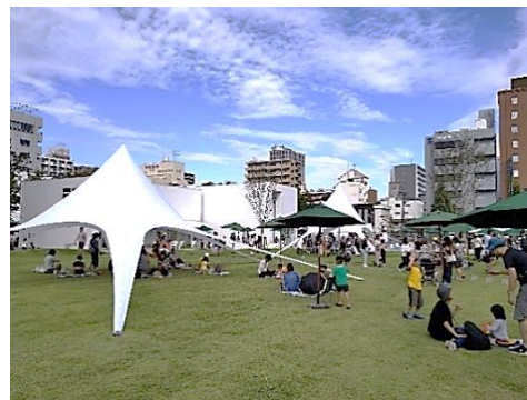
(下石井公園 / 岡山市)