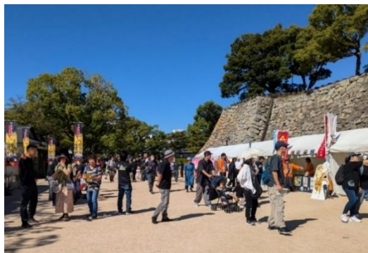
(烏城公園 (本丸エリア) / 岡山市)