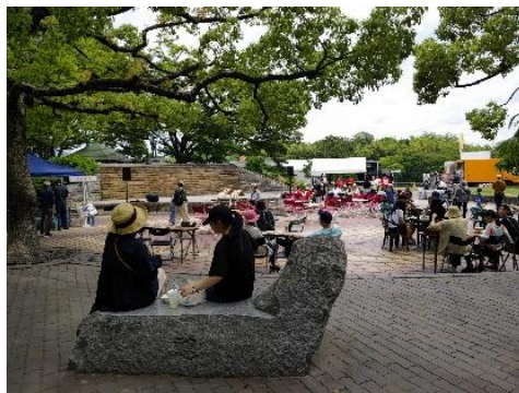
(烏城公園 (石山公園エリア) / 岡山市)