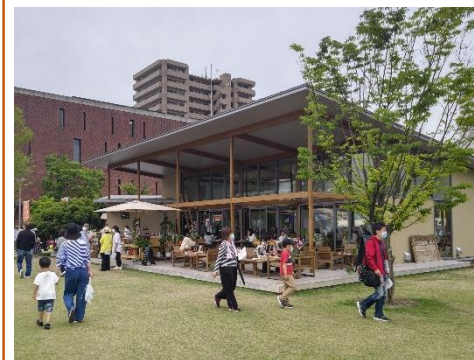
(レストラン / 福山市中央公園 / 福山市)