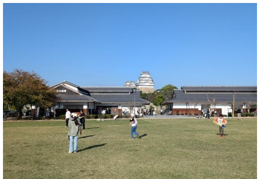
(姫路城 三の丸広場 / 姫路市)