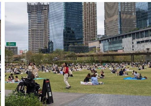
(うめきた公園 / 大阪市)