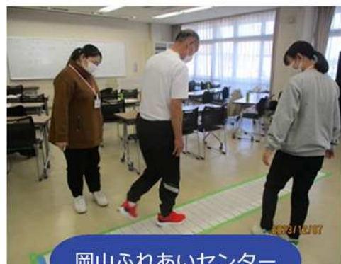
岡山ふれあいセンター