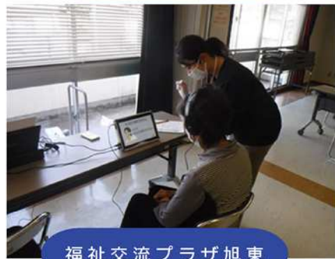
福祉交流プラザ旭東