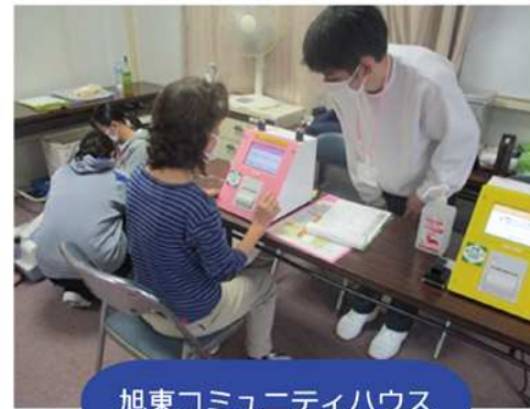
旭東コミュニティハウス