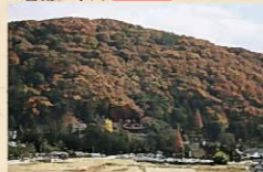
③吉備の中山 日本遺産

「杖草子」にもでてくる名山。温羅との戦いで吉備津彦命が布陣したと伝えられる。山頂南側には吉備津彦命の墓とされる全長約105mの中山茶臼山古墳がある。