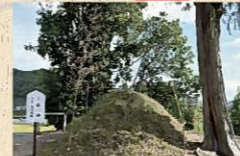
①白山神社の首塚 日本遺産

白山神社の境内に、未社の「米神」と呼ばれる高さ約1.5mの塚がある。温羅との戦いに勝利した吉備津彦命が温羅の首をね、串にさしてさらしたとされる場所。