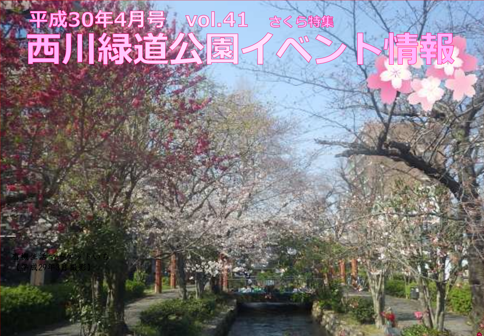
有機生活マーケットいち 【平成29年3月撮影】

新年度となる4月は皆さまにとって心機一転、新しい環境、新しい仲間、そして新しいチャレンジの始まりでしょうか？ そんな皆さまを応援するため、西川緑道公園ではにぎやかなイベントが本格始動します。また桜のこの季節、うら面では市内中心部で元気に咲き誇るさくらスポットをご紹介します！