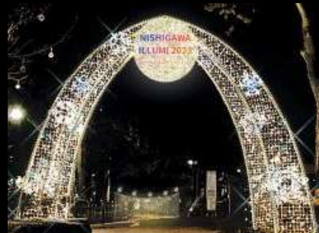
フェスティバルスターゲート