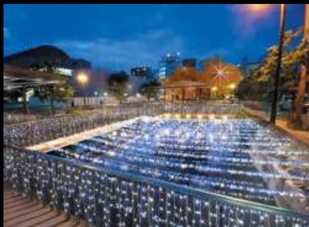
フェスティバルテラス