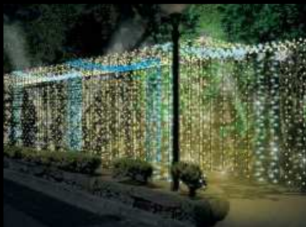
スターライトトンネル(幸橋～水上テラス)