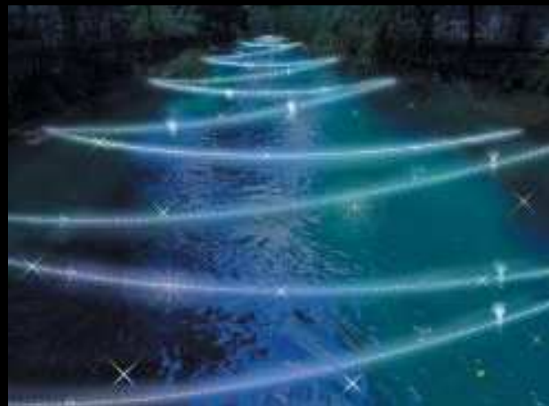
the surface of a river

今年のテーマは「光のウィンターフェスティバル」。全長約300mのシャンパンカラーに輝く光のトンネルや、木々を照らし出すライトアップ、水面にきらめく光など幻想的な世界をお楽しみください。